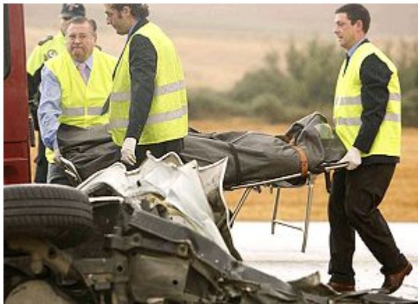
Gazte baten gorpua eramaten.

20-30 urte bitarteko gazteak ( joan ) _____ autoak aurrez aurre ( jo ) _____ beste batekin; lau gazteak bertan ( hil ) _____ eta beste ibilgailuko gidaria larri ( egon ) _____. Bihurgunerik gabeko eta ikuspen handiko bide batean ( jazo ) _____ istripua.