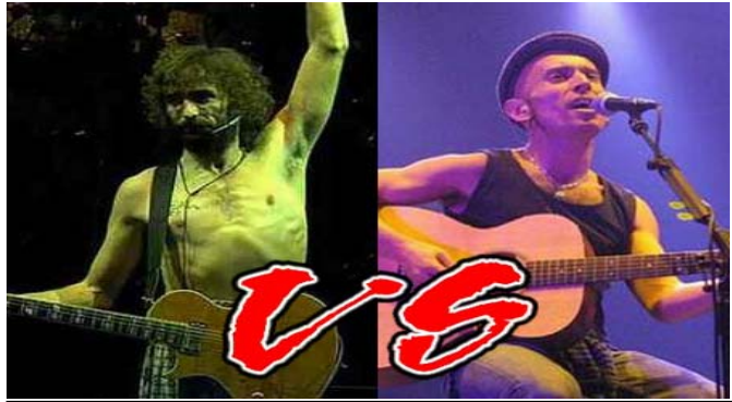
Robe Tniesta Vs Fito Cabrales